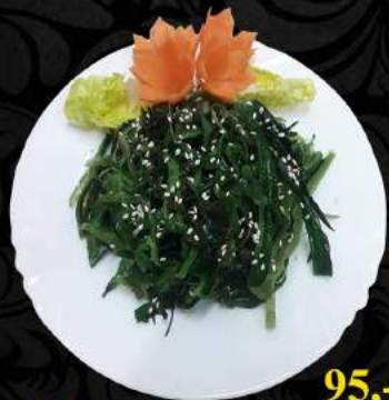
A7. Wakamen salát ● 95,-

Salát, sojové výhonky, okurky, mrkev, arašidy, koriandr Salad, soy sprouts, cucumber, carrot, peanuts, coriander