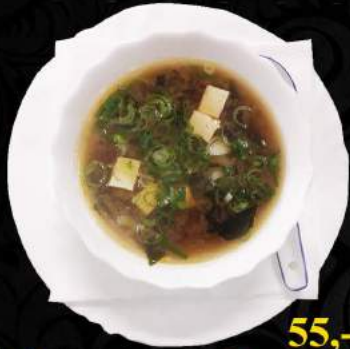
A1. Miso tofu ● 55,-

Tofu, sojová pasta, mořské řasy wakamen, jarní cibule, ředkev Tofu, soya paste, seaweed wakamen, spring onion, radish