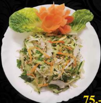
A6. Salát Vietnam ●● 75,-

Salát, sojové výhonky, okurky, mrkev, arašidy, koriandr Salad, soy sprouts, cucumber, carrot, peanuts, coriander