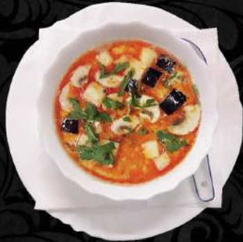
A3. Tom Kha Gai ●

Kuřecí maso, houby, cibule, bambus, vejce, jarní cibule Chicken, mushroom, onion, bamboo, egg, spring onion