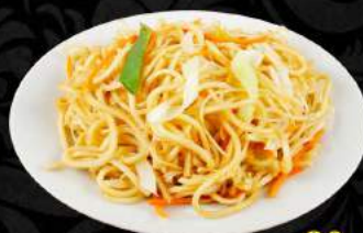
Nudle se zeleninou Noodles with vegetables