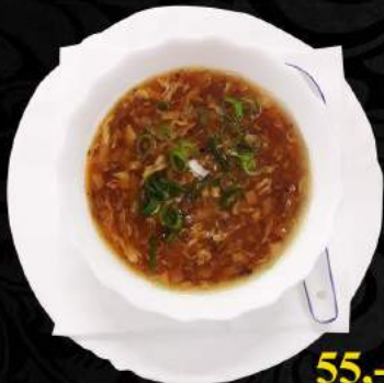
A5. Pikantní polévka ● 55,-

Krevety, rajčata, houby, lilek, bambus, koriandr, jarní cibule Shrimps, tomatoes, mushroom, eggplant, bamboo, coriander, spring onion