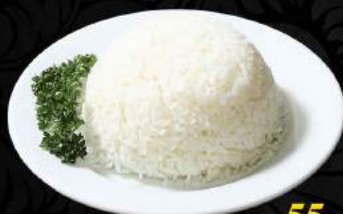
Rýže / Rice