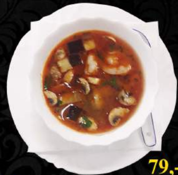
A4. Tom Yam Kung ● 79,-

Losos, sojová pasta, mořské řasy wakamen, jarní cibule, ředkev Salmon, soya paste, seaweed wakamen, spring onion, radish