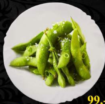
A8. Edamame 99,-