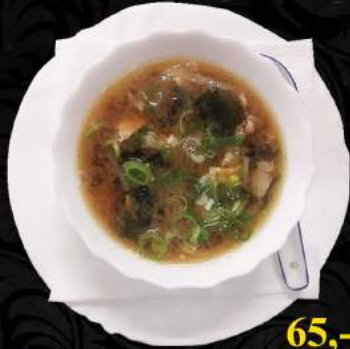
A2. Miso salmon ●● 65,-

Tofu, sojová pasta, mořské řasy wakamen, jarní cibule, ředkev Tofu, soya paste, seaweed wakamen, spring onion, radish