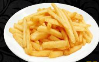
Hranolky / French fries